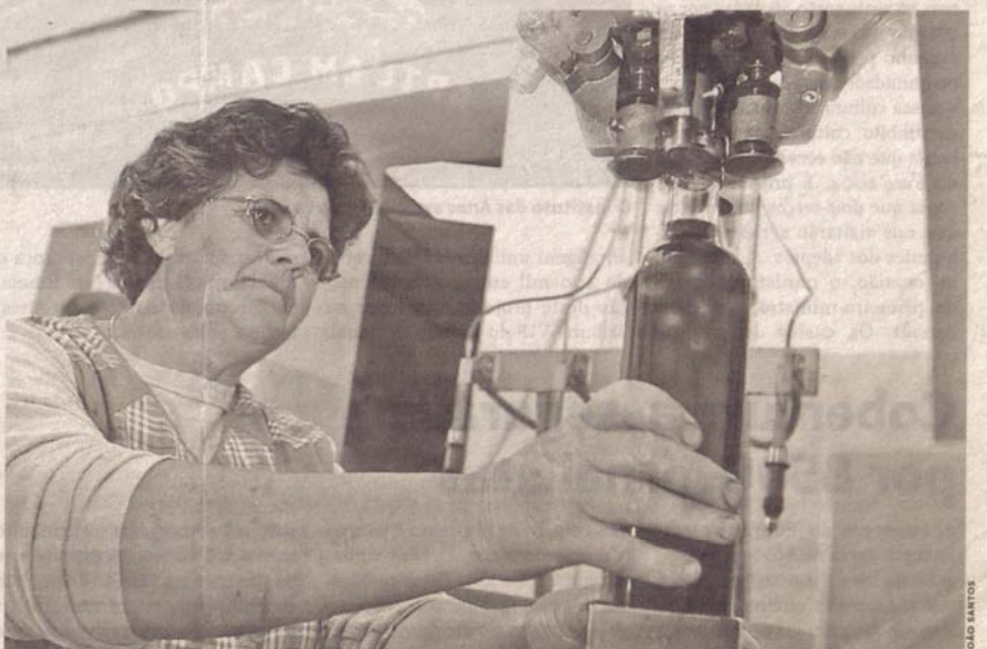
O engarrafamento é manual, bem como a colocação dos rótulos